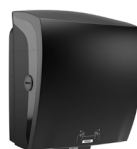
82070 Katrin System