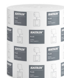
460058 Katrin Plus System Käsipyyherulla M 2-kerroksinen