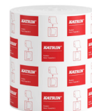
58198 Katrin System Käsipyyherulla M 2-kerroksinen