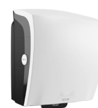
82094 Katrin System Handtuchrollenspender, Weiß