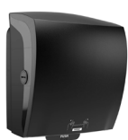
82070 Katrin System Handtuchrollenspender, Schwarz