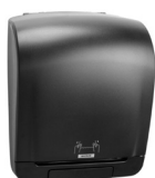
92025 Katrin System Handtuchrollenspender, Schwarz

Beispielhafte Auswahl aus allen Ländern. Die Verfügbarkeit für einzelne Regionen finden Sie auf der Webseite.