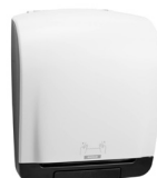
90045 Katrin System Handtuchrollenspender, Weiß