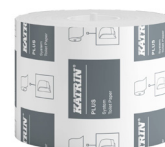
66940 Katrin Plus System Toilettenpapier 800 Blatt 2-lagig