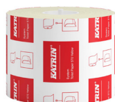
156104 Katrin System Toilettenpapier 567 Blatt 2-lagig, Gelb

Beispielhafte Auswahl aus allen Ländern. Die Verfügbarkeit für einzelne Regionen finden Sie auf der Webseite.