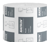
87365 Katrin Plus Dispenser Toilet Paper Roll System 684 Sheets 2-Ply