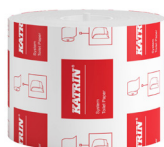
103424 Katrin System Toilettenpapier 800 Blatt 2-lagig