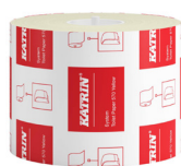
156104 Katrin Dispenser Toilet Paper Roll System 567 Sheets 2-Ply, Yellow

Medzinárodná ponuka, dostupnosť produktu pre SK nájdete na stránke.