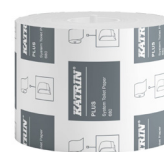
156052 Katrin Plus Dispenser Toilet Paper Roll System 680 Sheets 2-Ply