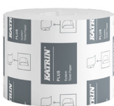
66940 Katrin Plus System toaletný papier 800 útržkov, 2-vrstvový