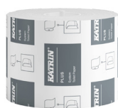
87365 Katrin Plus Dispenser Toilet Paper Roll System 684 Sheets 2-Ply