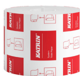
103424 Katrin System toaletný papier 800 útržkov, 2-vrstvový