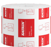
156007 Katrin Dispenser Toilet Paper Roll System 800 Sheets 2-Ply