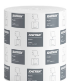
38015 Katrin Plus System Handtuchrolle M 3-lagig