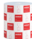
460263 Katrin System Handtuchrolle M 2-lagig, Blau