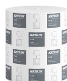
57795 Katrin Plus System Handtuchrolle M 2-lagig